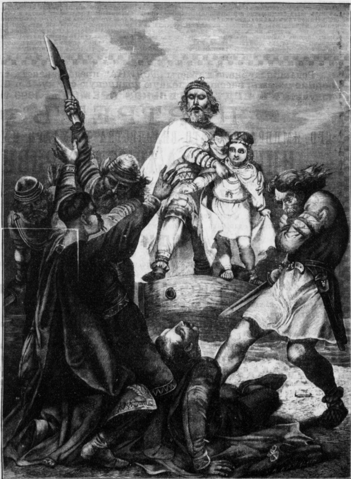
Олегъ и кievскіе князья Аскольдъ и Диръ. Съ карт. проф. Шарлемана. «Родина», 1896 г., № 47.

ОБЩЕДОСТУПНОЕ ДЕШЕВОЕ ИЗДАНИЕ ДЛЯ ВСѢХЪ И ОБО ВСЕМЪ.